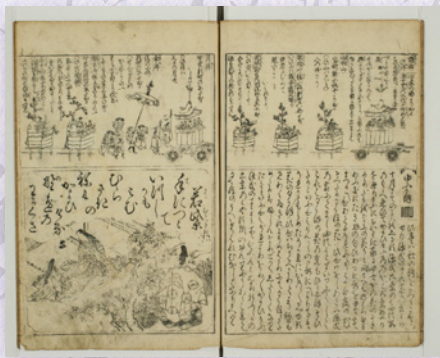
『女源氏教訓鑑』 元文 1 (1736) 年