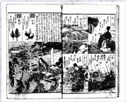
『絵入注釈百人一首』 嘉永 1 (1848) 年