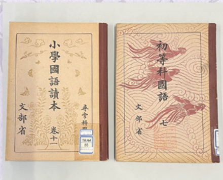
左『小學國語讀本：尋常科用 卷 11』昭和 14 (1939) 年 右『初等科國語 7』昭和 17 (1942) 年

* 往来物等特別コレクションの展示は 5 月 25 日 (土) から 30 日 (木) の間となります。