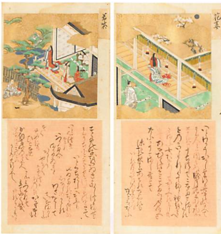
古土佐源氏五拾四状画賛