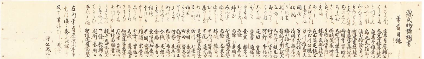
源氏御手かゝみ 筆者目録